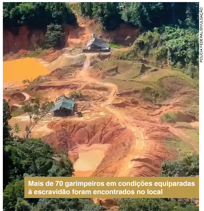
Mais de 70 garimpeiros em condições equiparadas à escravidão foram encontrados no local

A ação conjunta pretende, além de coibir atividades ilegais, proteger os direitos dos trabalhadores e preservar o meio ambiente.